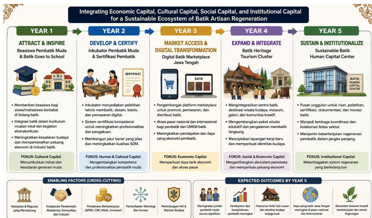
Gambar 2. Policy Roadmap